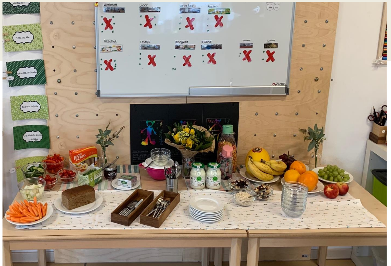
Bildunterschrift: Gesundes Büfett schaffte einen guten und gesunden Einstieg in den Tag und fördert die Kommunikation innerhalb der Gemeinschaft

„Abschied ist nicht das Schlimmste auf der Welt, dass man sich wiedersieht, das zählt.“