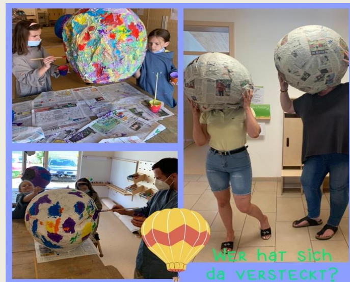
Bildunterschrift: Impressionen aus der Herstellung