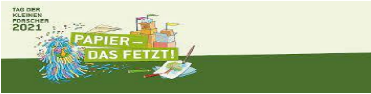
Bildunterschrift: Am 16.Juni 2021 war „Tag der kleinen Forscher, der bundesweite Mitmachtag für alle, die gerne forschen.“